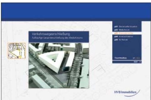
Mediaforum Stuttgart: CD-ROM