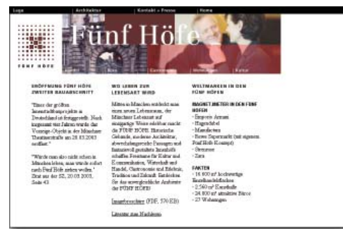
Fünf Höfe München: Print, CD-ROM, Web